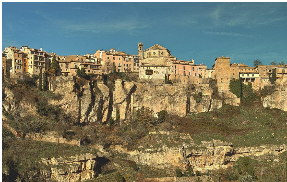
HOZ DEL HUECAR