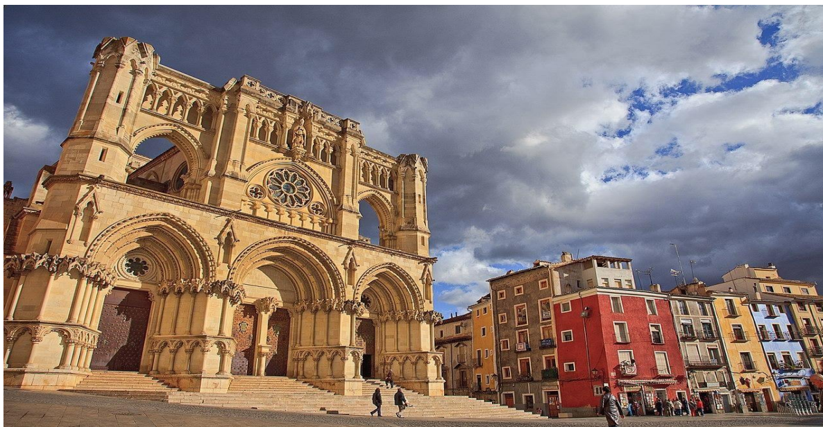
CATEDRAL DE CUENCA